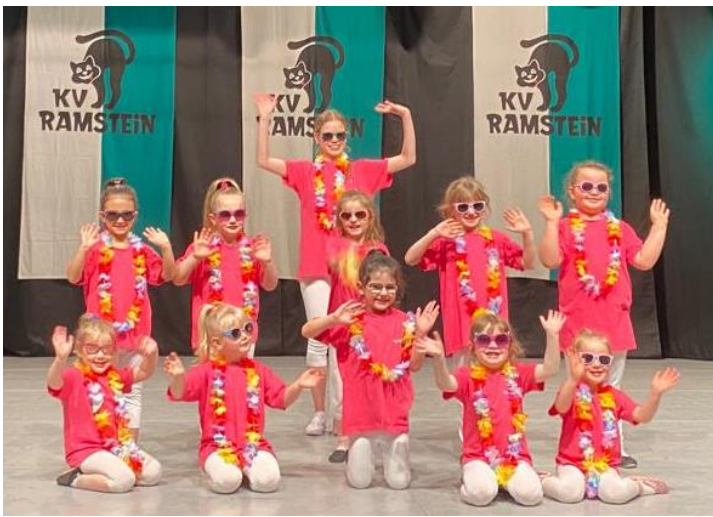
Ab in den Urlaub mit den Bambinis