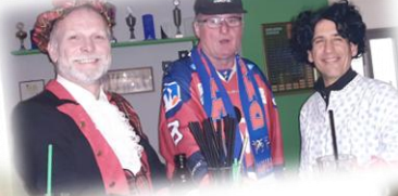
Elferräte am Rosenmontag